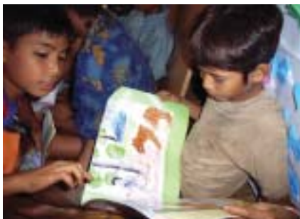
メラウ・キャンプの図書館にて

キャンプ、そして北西部に位置するメラウ・キャンプの2カ所を訪問しました。いずれも、メーホソン県にあります。パントラクター・キャンプは、1996年に正式に開設され、カレンニー族が約1万8000人暮らしています。現地の風土に合わせ、竹で作られた高床式の家が軒を連ね、10年近くの歳月をかけて整えられたキャンプ内の生活基盤は、地元NGOはじめ各支援機関の努力の結晶のように思われました。キャンプ内は、カレンニー難民委員会を筆頭に組織化されており、一つの社会が形成されていました。