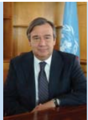
グテーレス第10代難民高等弁務官

またUNHCR駐日事務所に、新しい駐日代表ロバート・ロビンソン氏(米国)と副代表岸守一(きしもり はじめ)氏が着任しました。