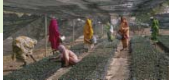
苗木を育てる難民女性