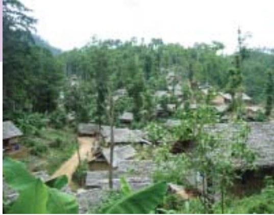
パントラクター・キャンプ