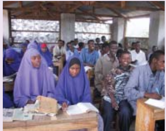
難民キャンプの教室

13年間も難民キャンプという鉄条網の中で暮らしてきた青年にとって、米国ニュージャージーでの大学生活は、考え方の違いや言語を初めとする数々