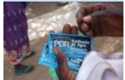
水をきれいにする錠剤