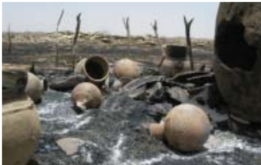
民兵に襲撃されて、焼き払われたダルフルの村