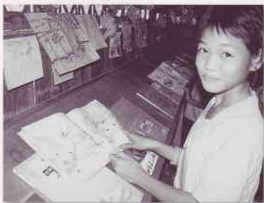
メラウ・キャンプでSVAが運営する図書館

「学校の先生やお医者さん?」と、通訳が気を利かせて彼の答えを促す。やっと彼は口を開いた。「人間になりたい」と。他の子どもも、「将来の夢」となると、しばらく考え込んで、「先生になりたい」「お医者さん」などと、通訳の促すままに答えるのだった。