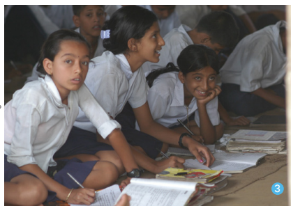
① 支援者の皆様からのお便り ©日本UNHCR協会 ② 食料配給をうけるジブチのソマリア・エチオピア難民。©UNHCR ③ ネパールのブータン難民の子どもたち。教室には机も椅子もない。 ©UNHCR ④ 子どもの栄養不良は将来に禍根を残すことに。©UNHCR

貧困と飢餓状態に後戻りさせられたと言われ、この大不況はさらに追い討ちをかけるでしょう。 アフリカなどの新興国での経済の悪化は、物価の高騰、失業の高まり、社会の不安定化をもたらし、周辺部に追いやられた人々を直撃しかねません。この結果、やむを得ず故郷をあとにす