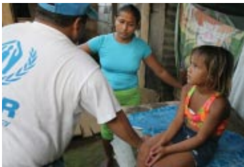
UNHCR職員と話すパナマに避難したコロンビア難民