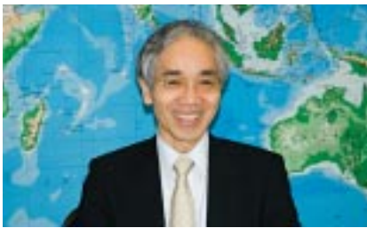
国連難民高等弁務官 (UNHCR) 駐日事務所 駐日代表 滝澤 三郎 (たきざわ・さぶろう)

日本人初のUNHCR駐日代表となり、29年ぶりに日本に帰ってきた。改めて日本は安全で住みやすく、便利な国だと感じる。そのような国に帰ってきて「お帰りなさい」と言ってもらえるのはありがたい。私たちには「帰りたい祖国」、「引きとってくれる祖国」がある。