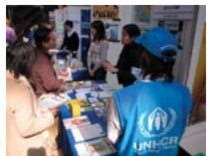
CLUB GEORDIEの皆さんが、UNHCRベストを着て帽子をかぶり、広い会場でのUNHCRブース宣伝に一役買ってくれました。

CLUB GEORDIEとのパートナーシップがあつてこそ、大阪でのイベント参加が可能となっています。日本UNHCR協会では、各地域に根ざした同様のイベントに、地域の方々のご協力を得ながらもっと参加したいと思っています。全国の学生グループなどからのご提案をお待ちしています。