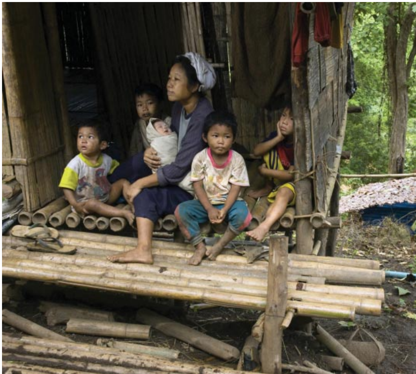
最近タイに到着したミャンマー難民の女性。7人の子どもの母。