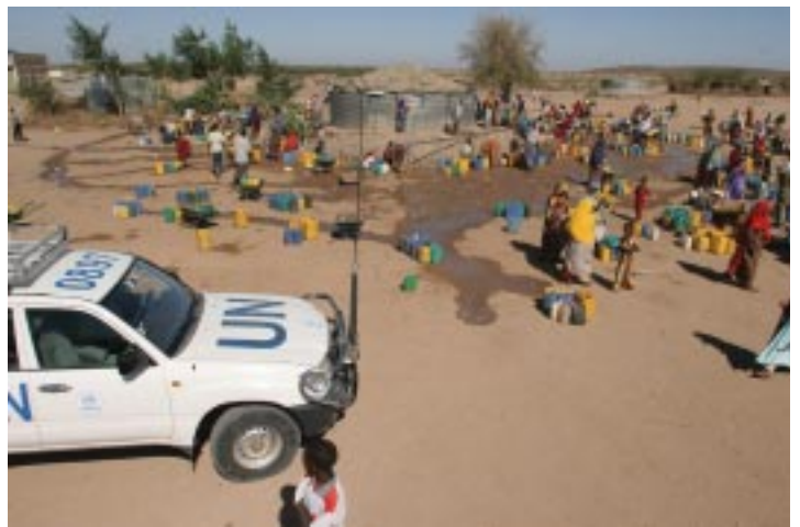
UNHCRが掘削した難民キャンプの井戸

を縮小せざるを得ないことが多々あります。そのため、UNHCRではすべての分野や地域の援助プログラムに適宜充当できる