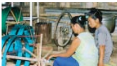
タイのキャンプで職業訓練を受けるミャンマー難民の女性

たとえば、2006年に起きたレバノン中東危機のような緊急事態には、各種の報道のおかげで、比較的迅速にご寄附が寄せられました。しかし、UNHCRの難民援助活動は、緊急事態を脱しても、解決の目処がたつまで続きます。10年、20年以上と続く場合もあります。長期化した難民問題にはなかなか関心が高まらないため、援助活動に必要な資金が不足し、援助プログラム